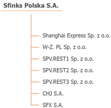
Tab. Struktura Grupy Kapitałowej.

Na dzień 30 czerwca 2020 r., na dzień 30 czerwca 2019 r. i na datę sporządzenia niniejszego sprawozdania w skład Grupy Kapitałowej Sfinks Polska wchodziły następujące spółki zależne powiązane kapitałowo: